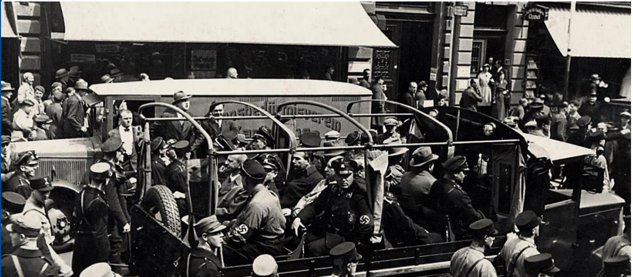
Bild: „Schaufahrt“ durch Karlsruhe