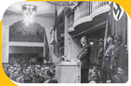
Adolf Hitler bei der Rede im Bürgerbräukeller. München, 8. November 1939.

Hitler will zunächst, wegen des Krieges und des unmittelbar bevorstehenden Angriffs deutscher Truppen im Westen erstmals bei den Feierlichkeiten zum Jahrestag des Hitlerputsches nicht selbst reden. Nur sein Stellvertreter Rudolf Heß soll sprechen. Hitler entschließt sich jedoch kurzfristig, diese Gelegenheit selbst für eine grundsätzliche Rede zu nutzen. Er spricht erheblich kürzer als bei früheren Feiern, weil er unmittelbar danach wieder nach Berlin zurückkehren muss.