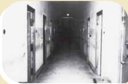
Zellengang im „Kommandanturarrrest“ des Konzentrationslagers Dachau.

Anfang 1945, vermutlich im Februar, überführt die Gestapo Georg Elser in das KZ Dachau. Er wird schwer bewacht im Zellenbau des Lagers in Einzelhaft. Auch in Dachau erhält Elser eine Hobelbank und kann auf seiner Zither spielen. Georg Elser ahnt wohl, dass er das Kriegsende nicht erleben wird. Mehrfach soll er darüber seine Besorgnis geäußert haben.