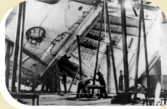
Der zerstörte Bürgerbräukeller, November 1939.

Bereits im Herbst 1938 entschließt sich der Schreiner Johann Georg Elser, die nationalsozialistische Führung – Hitler, Göring und Goebbels – zu töten. Er will so den drohenden Krieg verhindern. Elser weiß, dass Hitler immer am 8. November zum Jahrestag seines Putschversuches von 1923 im Münchener Bürgerbräukeller spricht. Elser verschafft sich schon 1938 Zugang zum Veranstaltungsort und stellt fest, dass der Saal nicht bewacht ist. In wochenlanger Arbeit präpariert er dort ein Jahr später eine tragende Säule mit einem Sprengkörper.