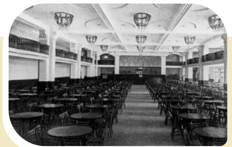
Der Saal des Bürgerbräukellers